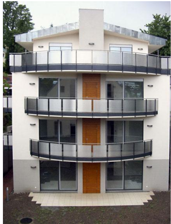
Figura 1 Appartamenti esclusivi

Alterna lavori pubblici come singolo professionista incaricato: Comune di Treviglio (Bg), - Casa di riposo di Pontoglio, - Comune di Pontoglio e Civate al Piano (Bg); ed in collaborazione: Comune di Brembate Sopra (Bg), - Azienda Ospedaliera Ospedale Treviglio e Caravaggio; oltre ad altri incarichi per pianificazione urbanistica, territoriale ed attuativa.