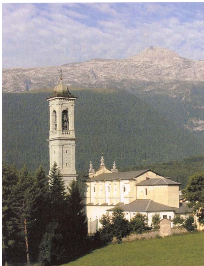
Intervento conservativo della Chiesa e del Campanile di Vilminore di Scalve (BG) - 1995/2000

L'eterogeneità dei temi affrontati ha consentito un utile e costruttivo scambio di informazioni tra settori e scale d'intervento diversi, difficilmente possibile in una situazione, come l'attuale, che sembra privilegiare forti specializzazioni e autonomie disciplinari. Basti una considerazione su tutte: l'intestazione del nostro Ordine.